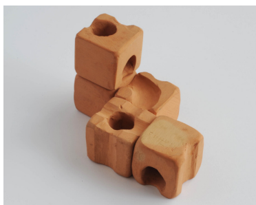
Prototyp des cuboro Kugelbahnsystems in Ton aus dem Jahre 1976