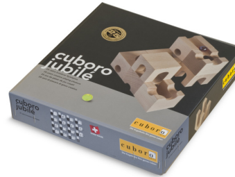
La noble boîte „cuboro jubilé“ à tirage limité, disponible au commerce spécialisé durant 2011