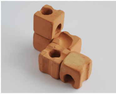
Prototype en argile du système cuboro en 1976